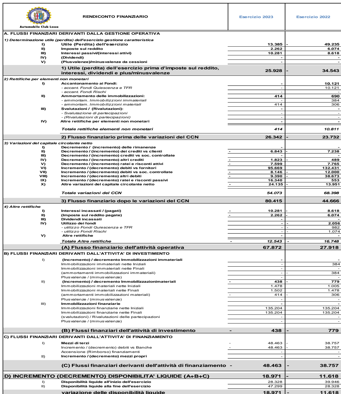
Tabella 2.2.5 – Situazione finanziaria

Da tale tabella emerge che, nel 2023, la gestione reddituale ha generato liquidità per €. 67.872 mentre le attività di investimento e finanziamento hanno assorbito liquidità rispettivamente per €. 438 e per € 48.463. Nel complesso, il rendiconto finanziario mette in evidenza che nel corso dell'esercizio l'Ente ha aumentato di €. 18.971 la consistenza delle disponibilità liquide.